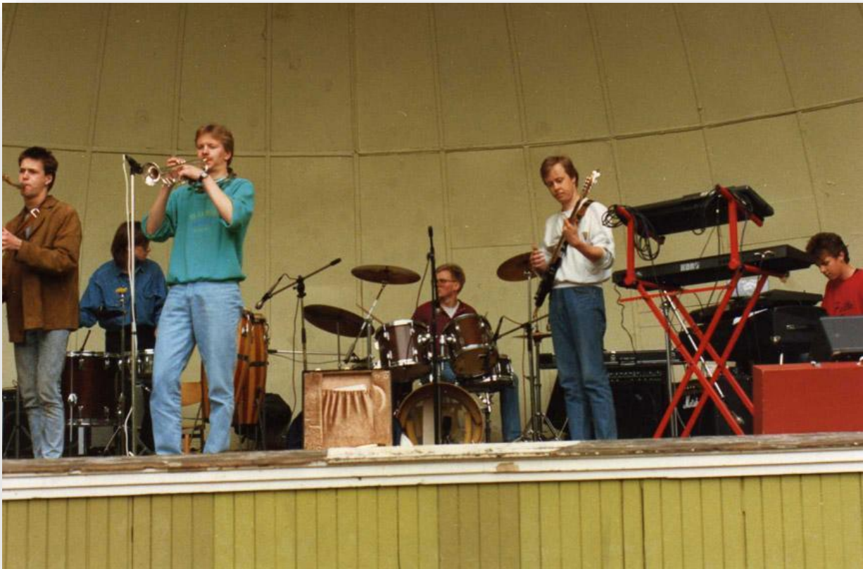
Mango Machine Länsipuistossa 1987