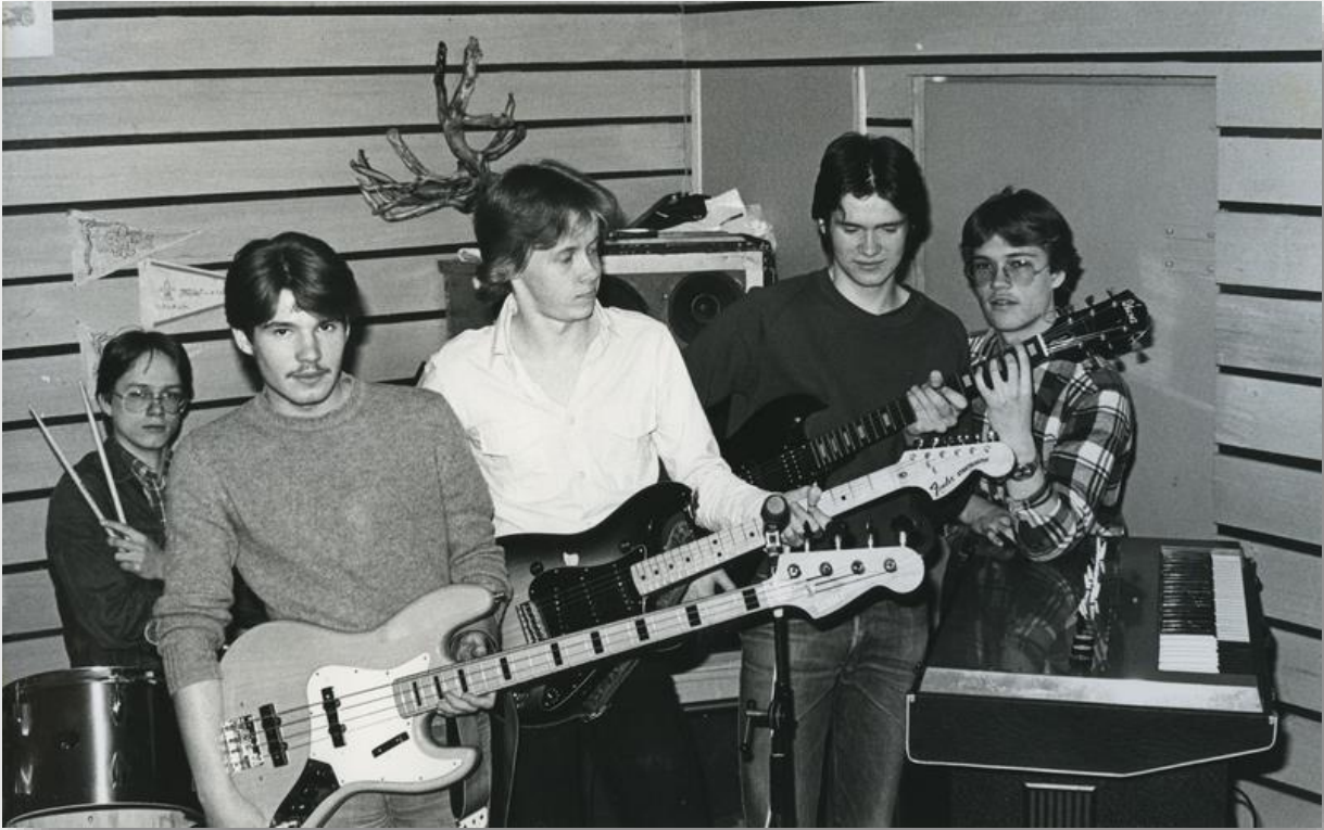
Grand Slam 1978