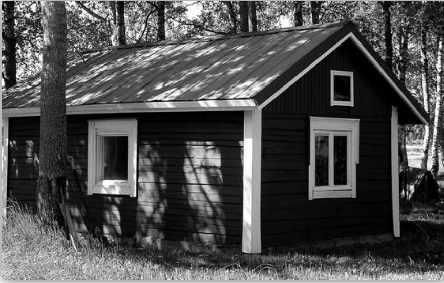
Legendarinen treenikämpä on edelleen pystyssä